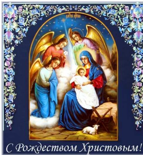
С Рождеством Христовым!

должны Его славить. «Христос рождается» — здесь употребляется настоящее время. Это значит, что Боговоплощение есть вечно живое событие в бытии всего мира, в истории человечества, в деле нашего спасения. Христос действительно постоянно рождается, и местом Его рождения — тем самым вертепом, той самой пещерой, теми яслями, в которых Он возлегал, — является наше сердце! Вот, где постоянно происходит рождение Христа Спасителя! Рождество Христово, совершившееся две тысячи лет назад в Вифлееме, — и ныне для нас близкое жизненно-спасительное событие. В эту священную ночь мы должны уподобиться и тем волхвам, которые пришли к Богомладенцу Христу и принесли Ему свои дары: золото, ладан и смирну.